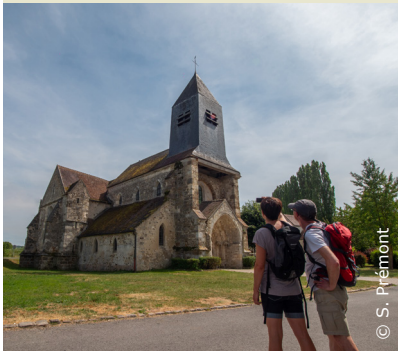
L'église de Saint-Eugène