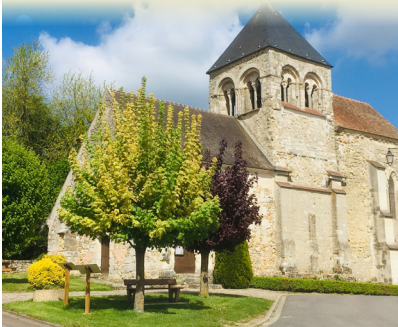
L'église de Celles-lès-Condé

INFOS TOURISTIQUES : Maison du Tourisme Les Portes de la Champagne Tél. : 03 23 83 51 14