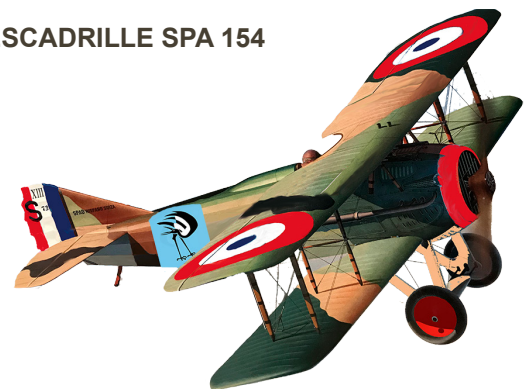
Reproduction du SPAD de Moissinac, arborant l'insigne de l'escadrille 154

Créée en 1917 à Matigny au Nord-Est de Ham, l'escadrille 154 adopte comme symbole une grue noire et blanche à la tête retournée, pictogramme adopté pour le balisage de cette balade. Sa spécialité est l'attaque des ballons d'observation ennemis. Participant aux contre-offensives de l'armée française en 1918, elle parvient à détruire 38 ballons ennemis, devenant la meilleure escadrille de l'armée française à réussir ce sport dangereux qui cause néanmoins de lourdes pertes. La SPA 154 termine la guerre avec 64 victoires homologuées et 12 probables, le 10 e meilleur score de l'armée française pendant la Grande Guerre.